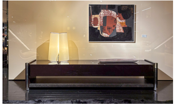
PASSARELLA Marcio Kogan / Studio MK27