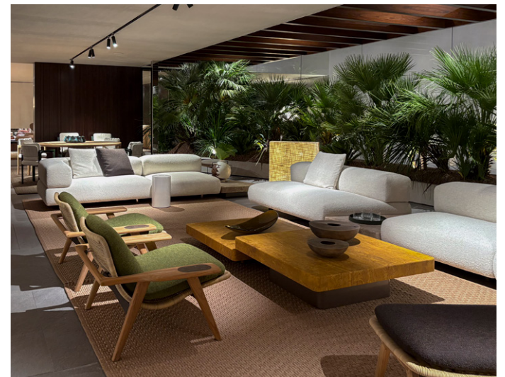
ELAS CORD OUTDOOR Marcio Kogan / Studio MK27