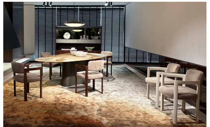
BÉZIER DINING Marcio Kogan / Studio MK27 GIULIETTA Inoda+Sveje