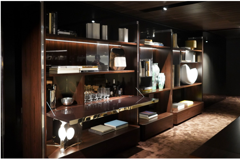
ATLAS Giampiero Tagliaferri