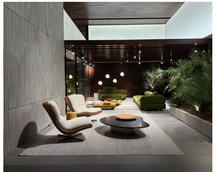
ELAS Marcio Kogan / Studio MK27