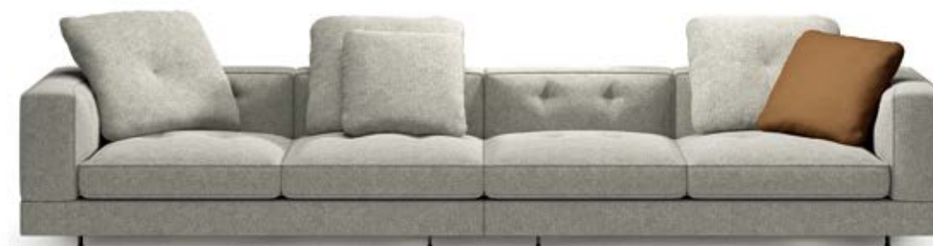
DYLAN LOW / LOW BASE / SEAT DEPTH 102 CM