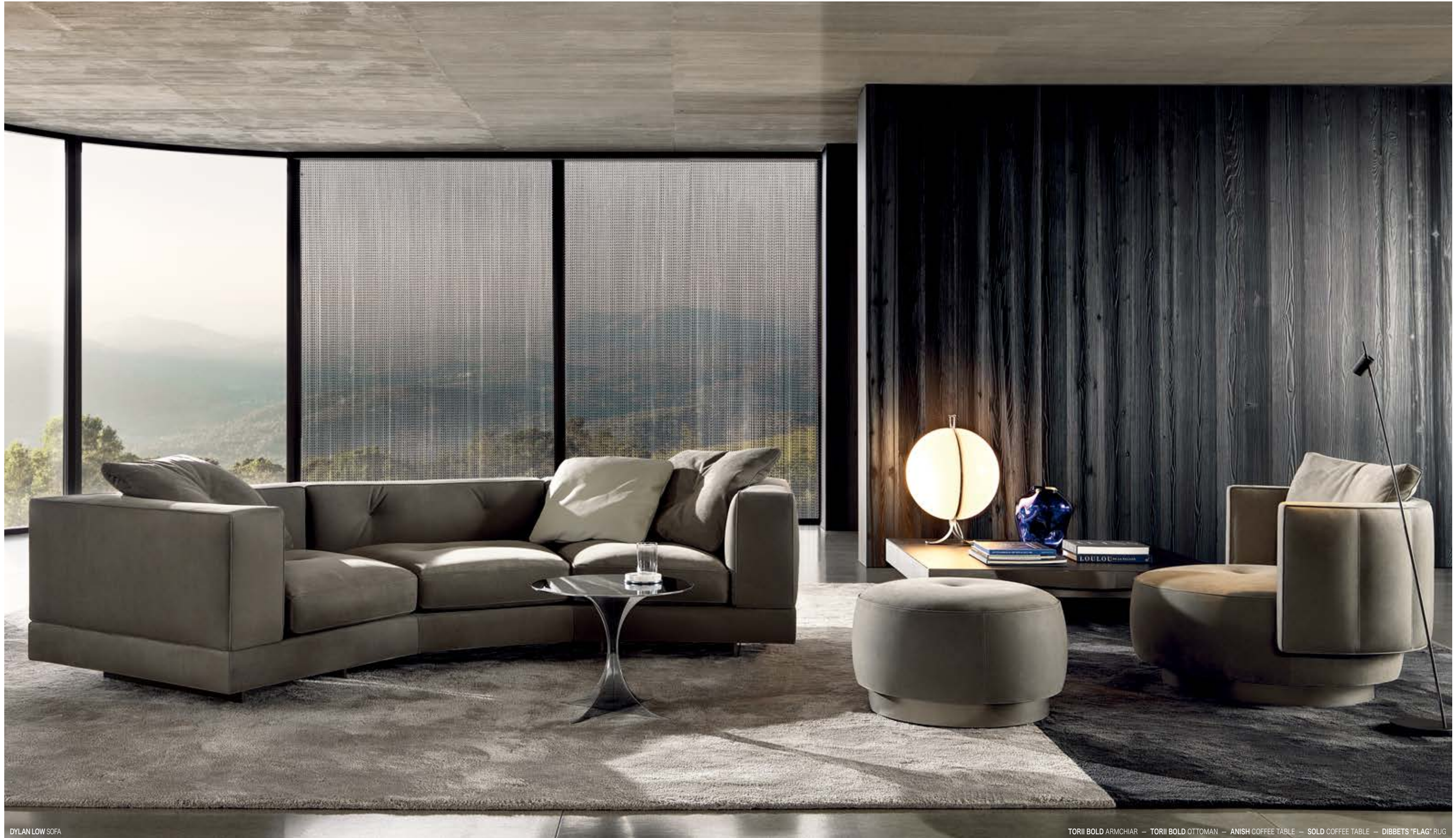
DYLAN LOW SOFA