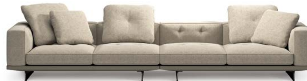
DYLAN / HIGH BASE / SEAT DEPTH 102 CM / BASE IN LEATHER OR FABRIC

Minotti のモダニズムを集約した DYLAN モジュラーシーティングシステムには、3つのバリエーションがあります。床から 13.5cm 浮いたエアリーな「DYLAN」、床から 7.5cm と重心を低くした「DYLAN LOW」、奥行き 87cm のコンパクトな「DYLAN SMALL」。3つの異なるタイプを結びつけるのは、クチュールによる柔らかなステッチが刻まれたシートとバッククッションです。現代的なモジュラーシステムでありながら、時代を超えた職人的な椅子張りの仕立てと、多角的な建築のビジョンが融合した、ライフスタイルとの完璧な融合をはかれる秀逸なシーティングシステムが生まれました。