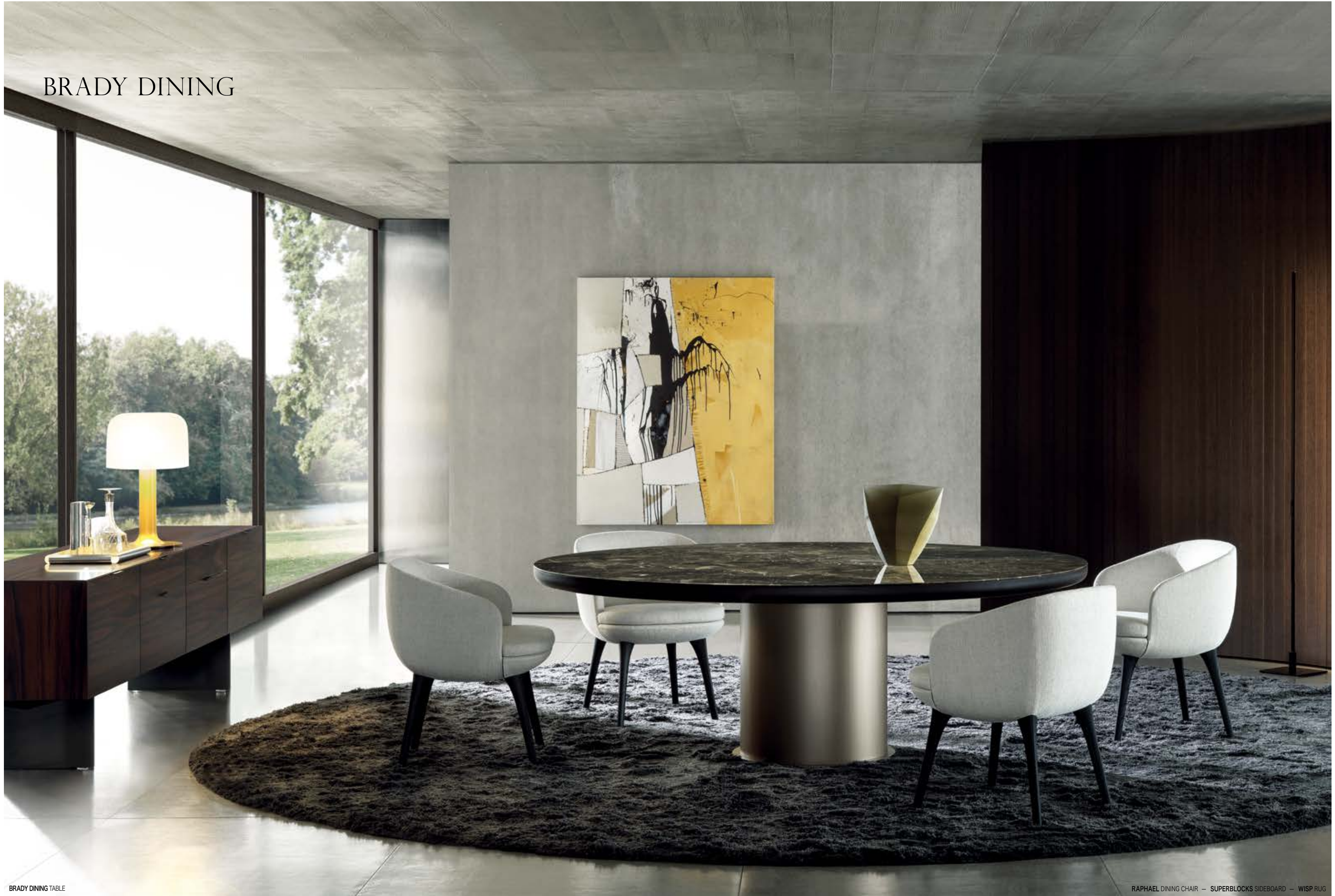
BRADY DINING TABLE