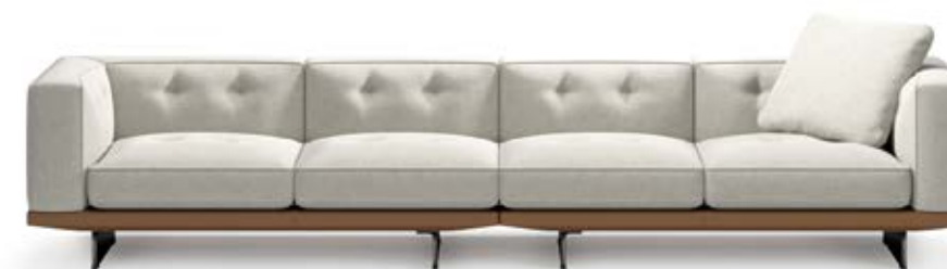
DYLAN SMALL / HIGH BASE / SEAT DEPTH 87 CM / BASE IN LEATHER OR FABRIC