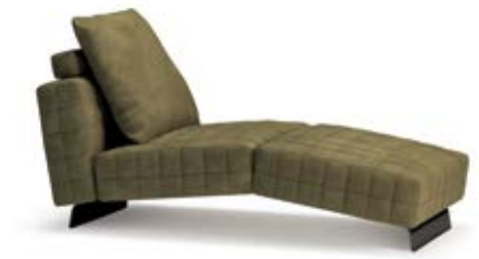
TWIGGY COMFORT COUCH

洗練されたサルトリアテイストを表現したTWIGGYのベッドバージョンです。ベースやヘッドボードはファブリックまたはレザー張りで、彫りの深いステッチで装飾されています。同じデザインのナイトベンチや、デイベッドのように使えるカウチもあります。